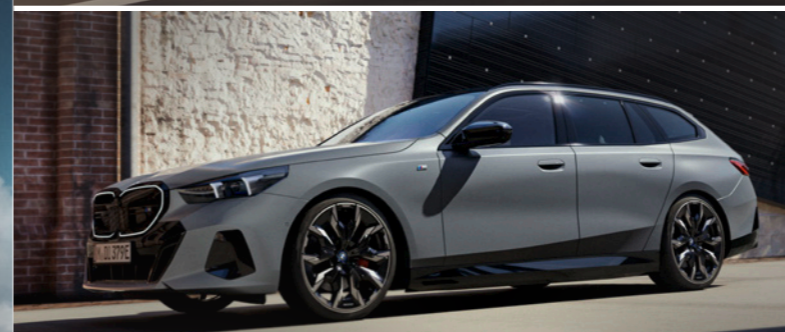
THE i5 Touring