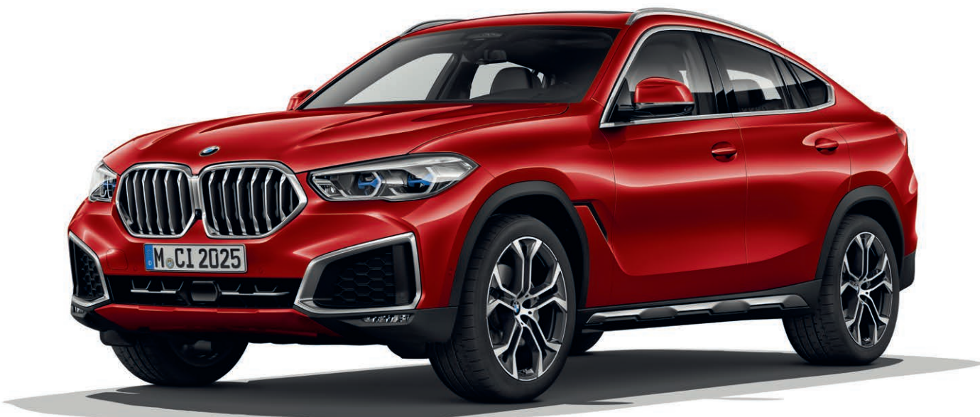
7HW - xLine - BMW X6 xDrive40i, metalický lak Flamenco Red (volitelná výbava), 21" kola z lehké slitiny Y-spoke 744 (volitelná výbava)