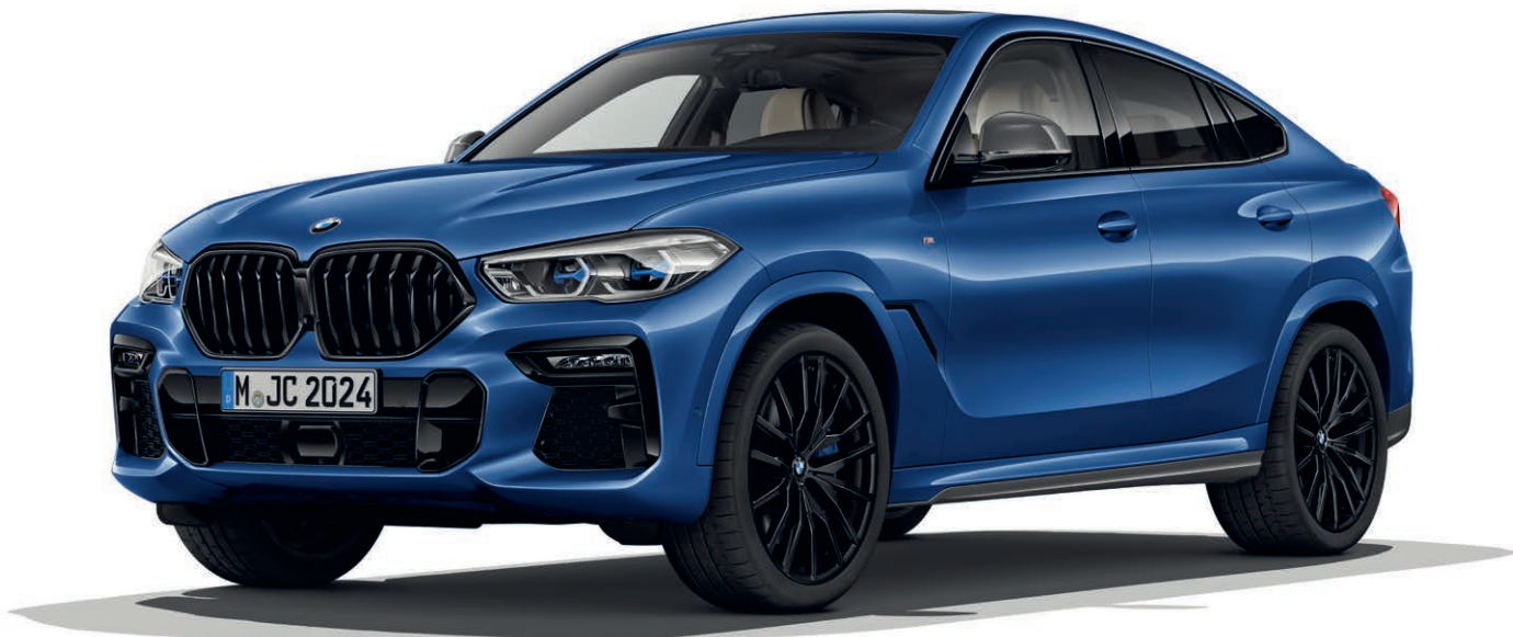
337 - M sportovní paket - BMW X6 xDrive40i, metalický lak Riverside Blue (volitelná výbava), 22" M kola z lehké slitiny Double-spoke 742 M, Jet Black (volitelná výbava), M Shadowline černé vysoce lesklé okenní lišty s rozšířeným obsahem (volitelná výbava), M karbonové kryty vnějších zpětných zrcátek (volitelná výbava)